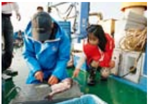
▲(上)今日は大漁! (下)希望によっては獲った魚を味見することも