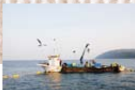
◀定置網を挟んだ向こうにも、船がスタンバイ