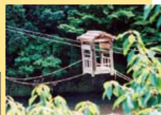
▲すぐ下は川！宙に浮かぶ心地良さに加えて、スリルも味わえちゃう

何でも手に入る都会で、生活に欠かせない身近な物事へのありがたみを教えることは、パママ&学校の先生でさえもなかなか大変。その点、街を離れた田舎で暮らす人たちは、不便を便利に変える技のスペシャリスト！昔の日本に飛び込んで、自給自足を体感しよう。