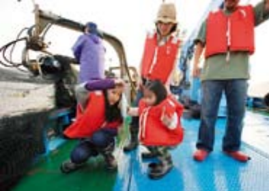
▲小さなアジやイカが船上に。小魚は海に投げると、ウミネコが上手にバクツ