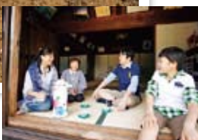
▲おばあちゃん家のような民宿の縁側