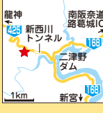
MAP P142 B-3

V 0746-64-1111 a 吉野郡十津川村平谷909-4 b 近鉄大和八木駅からバスでホテル昴まで約4時間30分 c 南阪奈道路葛城ICから約3時間