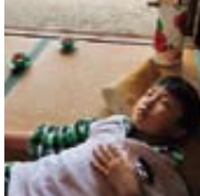
▲疲れて…zzz。ひと仕事した後の昼寝は格別