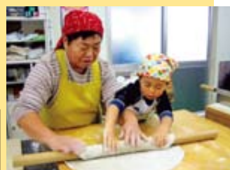
▲打ったそばはかけそばやおろしそばで味わったり、持ち帰りもOK