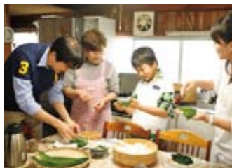
▲おむすびを巻く高菜は、軸のツルとした方が表。「ママのは破れてる(笑)。僕の方が上手」