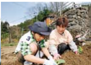
▲キャベツの苗を植え付け。バラバラの葉に驚き